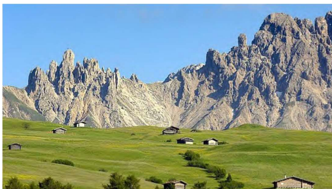
Roßzähne, Schlern, Hotel Rosa